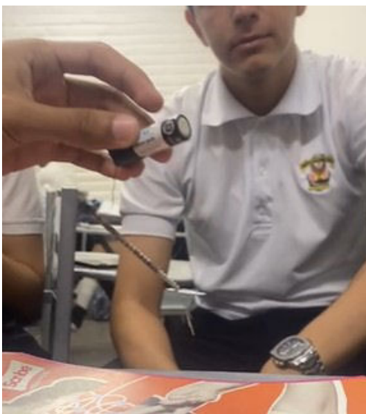
FIGURA 2. Electroimán fabricado en el aula.

Estudiante 1 (mecánico de motocicletas) “ empecé a relacionar conceptos de inercia al explicar porque los vehículos necesitan más fuerza para arrancar que para mantenerse una vez que está en movimiento. Además, comprendí la fricción al relacionarlo con el desgaste de las llantas y los frenos de los carros, sentí que comprendía más fácil los conceptos cuando los relacionaba con algo de mi trabajo ”. Por su parte la estudiante 2 (cajera de Oxxo) comentaba que la física no era lo suyo, “ pero empecé a relacionar los conceptos cuando el maestro nos dijo que la electricidad era también parte de