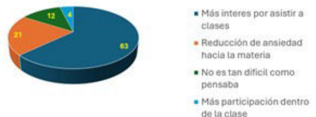
FIGURA 3. Cambio de actitud hacia la materia de Mecánica.