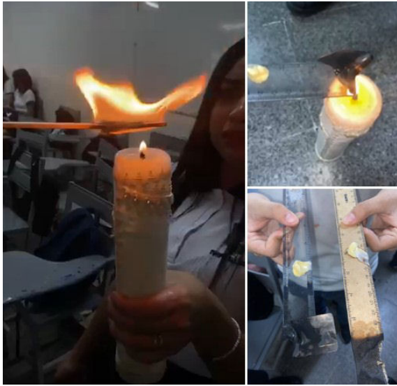
FIGURA 1. Uso de la Física en el aula.

El cambio siempre viene marcado por una concepción, Ausubel [2] llama a esta percepción un aprendizaje más profundo lo que significa que el estudiante comienza a relacionar todos los conceptos y contenidos adquiridos dentro del aula con algo común visto en su quehacer diario.